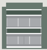
Ιδιωτική Εκπαίδευση - Κοινωνική Μέρηνα